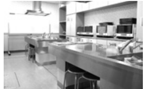
IHクッキングヒーターなど各種調理器具完備。 調理実習や料理教室にご利用ください。

使用料金(平日・土・日・祝日共通) ※空室状況や利用申込方法などは市民交流センターへお問い合わせください。