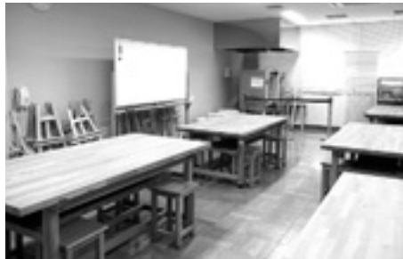
電動ろくろなどを揃えています。 絵画や陶芸などのサークル活動にご利用ください。