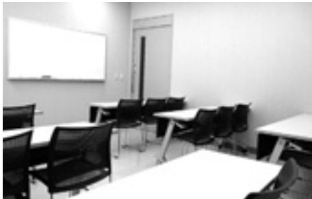
小人数での研修や会議などにご利用ください。