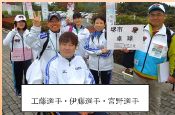
工藤選手・伊藤選手・宮野選手

和歌山大会に続き、3名が代表選手として参加しました。前回できなかったことも1年間練習をして良い内容の試合となりました。努力は、3人とも金メダルです。