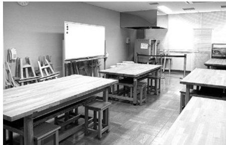
電動ろくろなどを揃えています。 絵画や陶芸などのサークル活動にご利用ください。