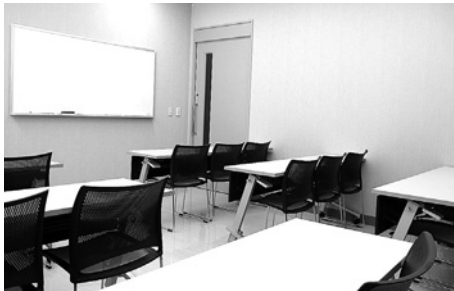
小人数での研修や会議などにご利用ください。