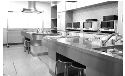
IHクッキングヒーターなど各種調理器具完備。 調理実習や料理教室にご利用ください。

使用料金(平日・土・日・祝日共通) ※空室状況や利用申込方法などは市民交流センターへお問い合わせください。