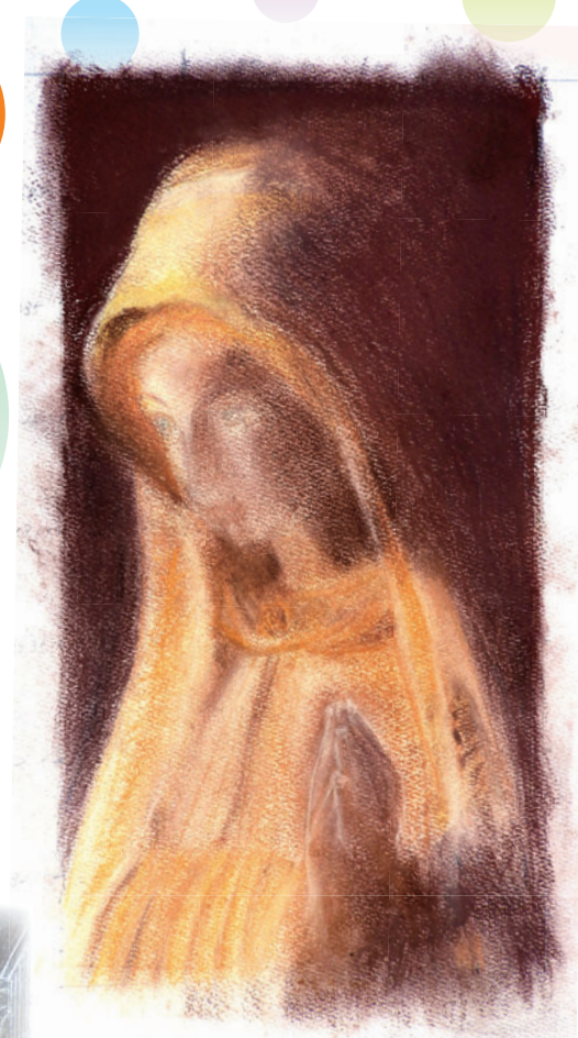
「マリア様と」憧れの女性像であるマリア様。 祈りの姿を心を込めて描きました。