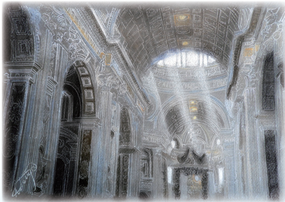
「光のあるうちに」教会が好きです。光が差し込む様子を描きたくて手掛けた作品です。