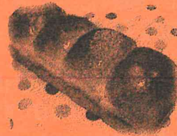
ちぎりパン (イメージ例)

ちぎりパンと蒸しパンの 2種類のパンをつくります。 夏休みの思い出に皆でパン 作りをたのしみましょう。