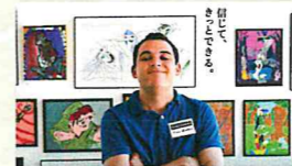
世界中の映画祭で賞と涙の大喝采! ディズニーアニメーションを通じて、自閉症を克服した家族の記録