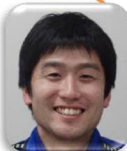
スポーツセンター所長