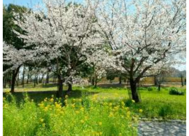
堺市立健康福祉プラザ隣接の大仙公園の桜

さて、2012年(平成24年)4月1日に開所した当センターも、15年目を迎えます。ここまで、きこえない・きこえにくい方々を取り巻く環境は少しずつ整備されてきました。昨年6月に「手話施策推進法」が施行され、11月には東京2025デフリンピックが開催されたことで、手話への関心も高まっています。ただ、きこえない・きこえにくい方々が、きこえる人と同一時期に同一内容の情報を受け取れているか、同じように様々な場所に参加できているか、そこにはまだまだ大きな課題があると感じています。「聴覚障害者情報提供施設」の名の通り、みなさまに少しでも早く、わかりやすい情報をお届けできるよう、そして、合理的配慮が広がるよう、今年度も職員一同、取り組んでまいります。新年度もどうぞよろしくお願いいたします。