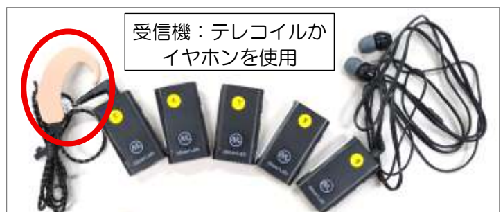
受信機：テレコイルイヤホンを使用

また、受信できるイヤホンや集音器もいくつか登場しています。スマートフォンと Bluetooth(ブルートゥース)で接続して使うタイプが多いので、スマートフォンをお持ちでない方はご注意ください。