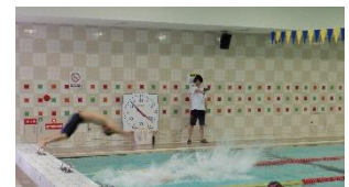
※昨年度に開催した時の写真です。