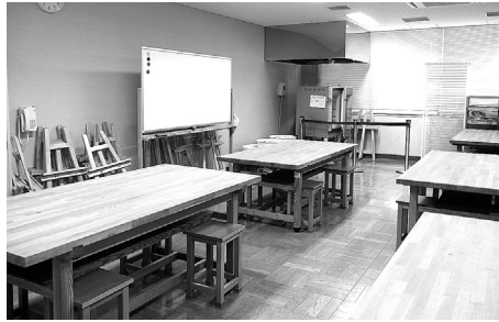
電動などろくろを備えています。 絵画や陶芸などのサークル活動にご利用ください。