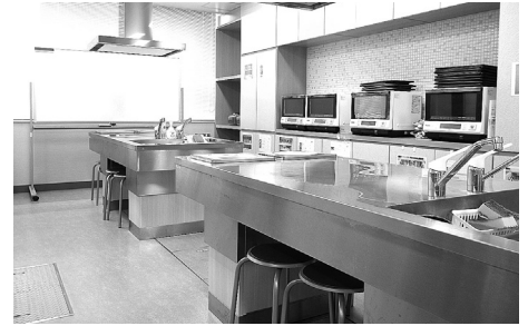
IHクッキングヒーターなど各種調理器具完備。 調理実習や料理教室にご利用ください。

使用料金(平日・土・日・祝日共通) ※空室状況や利用申込方法などは市民交流センターへお問い合わせください。