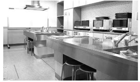
IHクッキングヒーターなど各種調理器具完備。 調理実習や料理教室にご利用ください。

使用料金(平日・土・日・祝日共通) ※空室状況や利用申込方法などは市民交流センターへお問い合わせください。