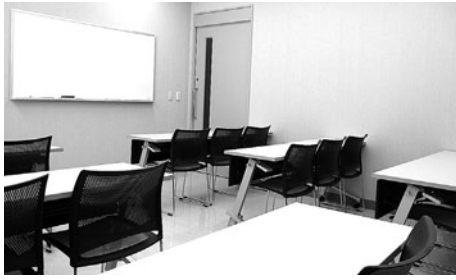
小人数での研修や会議などにご利用ください。