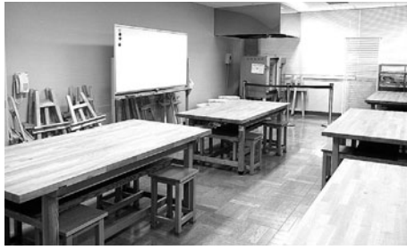
電動ろくろなどを揃えています。 絵画や陶芸などのサークル活動にご利用ください。