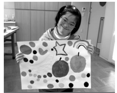
障害者のためのアートスクール

市民交流センターの教室は、全体の参加者の約8割が障害のある方にご参加いただいております。障害のある方々に個別に配慮できるよう、少人数制での開催やお一人で不安な方には職員がお手伝いをしたり、聴覚障害のある方で手話通訳者や要約筆記者を必要とされる方には通訳者の配置等、さまざまな個別配慮を行っております。今後も皆さんの自己実現ができるよう、取り組んで参りたいと思います。教室に興味はあるが、障害があるために参加することをためらっておられる方は、ぜひ、一度市民交流センターの教室にご参加ください。