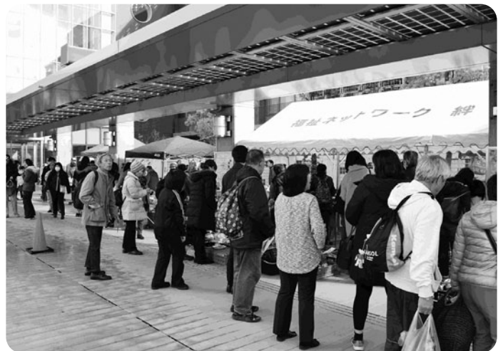
障害者週間フェスティバル

また、当センターの業務では、来館者の皆様が、安全で安心して、快適にご利用いただけるよう、プラザ全体の施設維持管理業務も担っています。