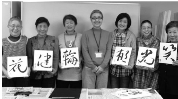
楽しく始めま書(しょ)！