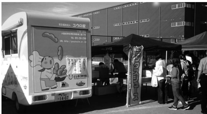
全星薬品工業様イベント