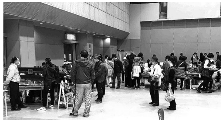
サンスクエアフェスティバル