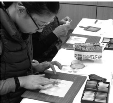
指で描くパステルアート教室