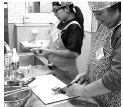
障害者のための料理教室