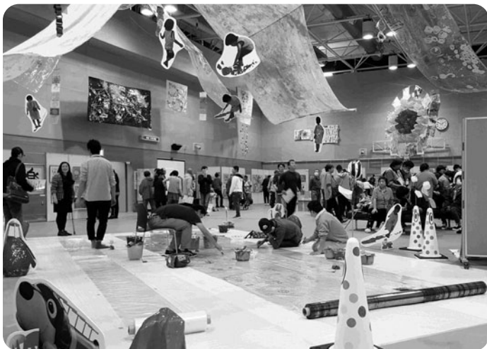
アートフェスティバル