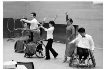
NPO法人近畿車いすダンスクラブ