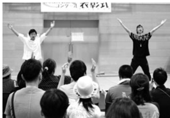
手話パフォーマンスDDD