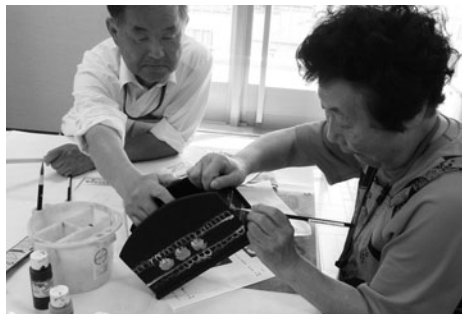
新企画! トールペイント教室