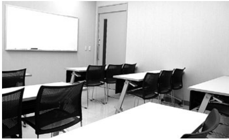
小人数での研修や会議などにご利用ください。