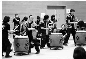
和太鼓サークルどん舞

そのほか「点字体験」「記憶力チェックコーナー」「お遊びコーナー」「減農薬野菜販売」など、多くのイベントで春の季節を彩り、ご来館された皆様に春のプラザ祭りを楽しんでいただきました。