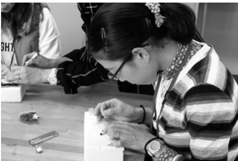
新企画! 羊毛フェルト教室

今後も多くの方々に楽しんでいただき、利用者の繋がりを作っていただけるような教室を企画して参りますので、ぜひご参加ください。