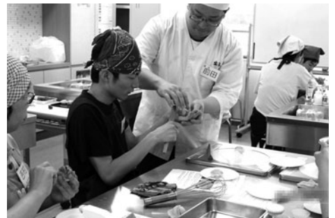
大好評! 初夏の和菓子教室