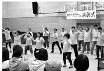
NPO法人ボノボきら☆きらクラブ