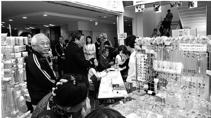
市長が授産製品販売を見学中