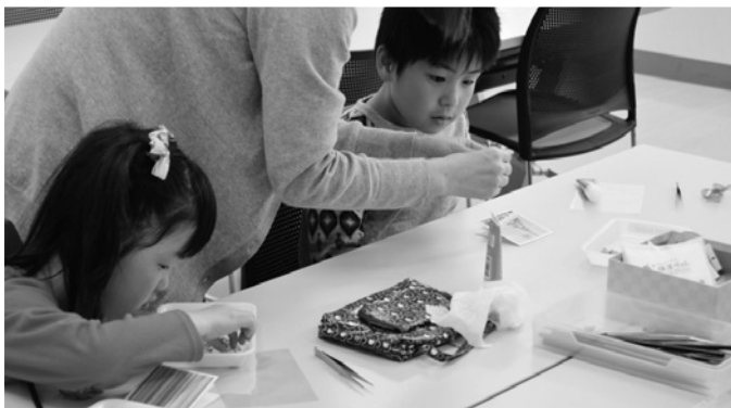
子どもたちがクラフト体験に夢中