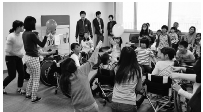
関西大学ボランティアサークルWEVOと子どもたちが車いすでレクリエーション

授産活動支援センター 日中活動の中で取り組む、ものづくりや作業のことを「授産(じゅさん)活動」といいます。