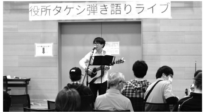
聞いて楽しい即興モノマネライブ