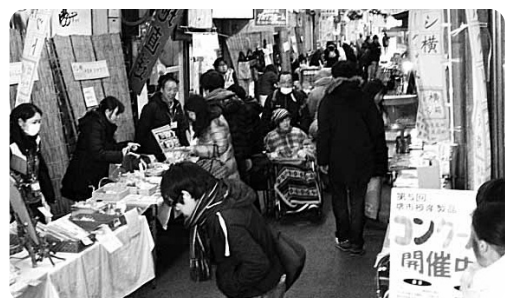
※写真は昨年の様子

今年度も、堺市授産製品コンクールが開催される時期となりました。堺市内の授産施設から応募された製品が、市民と専門家により審査され、優秀な製品に賞が贈られます。最初の審査である、市民による一般審査が、堺東商店街の「ガシ横マーケット・プラス」会場で開催されます。来場された方に、応募施設が展示する製品を見て、試食して、気に入った製品を選んでいただくイベントです。応募製品以外にも多くの製品が販売されますので、ぜひお越しください。