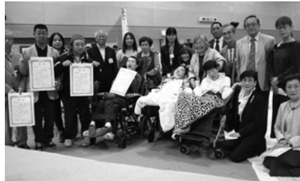
【アートフェスティバル】