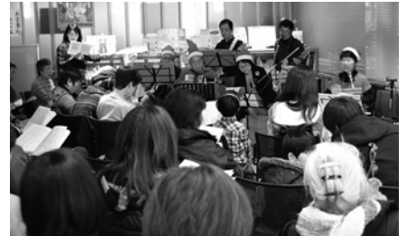
【障害者週間フェスティバル】