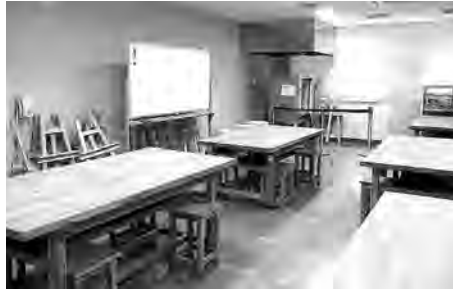
電気陶芸窯、電動ろくろを備えています。 絵画や陶芸などのサークル活動にご利用ください。