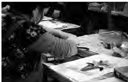
ステンドグラス教室