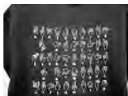
▲雑貨部門 金賞 「ほくぶ指文字ほーちゃんトレーナー」 ほくぶ障害者作業所