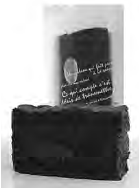
▲堺市長賞 「コアントローショコラ」 愛和ハウス

受賞商品については、堺市より表彰され、授産活動支援センターからも積極的に広報しています。商品詳細については、センターまでご連絡ください。