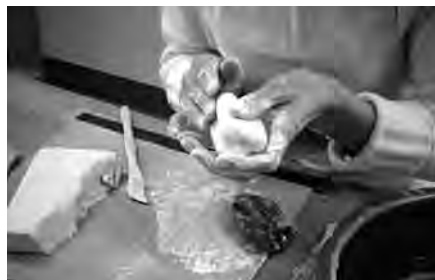
視覚障害者のための造形教室