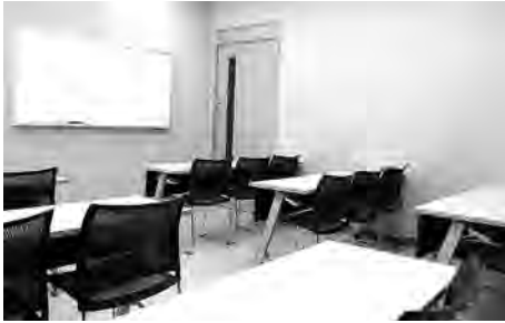
小人数での研修や会議などにご利用ください。