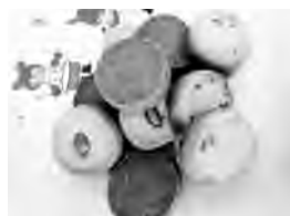
▲食品部門 銀賞 「やさしい畑クッキー」 第2ほくぶ障害者作業所