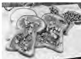
▲食品部門 金賞 「古墳ラスク」 アトリエ ユウの家