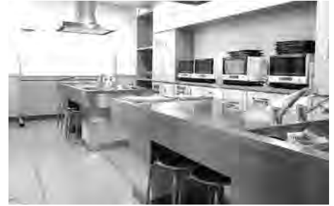
IHクッキングヒーターなど各種調理器具完備。 調理実習や料理教室にご利用ください。

使用料金(平日・土・日・祝日共通) ※空室状況や利用申込方法などは市民交流センターへお問い合わせください。