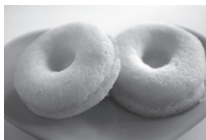
金賞【食品部門】 焼きドーナツ(ゆず)(麦の会共同作業所)