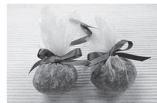
金賞【雑貨部門】 ラベンダー匂い袋(かんぎ作業所)

※製品等に関するお問い合わせは、授産活動支援センターまで。電話：072-275-5018