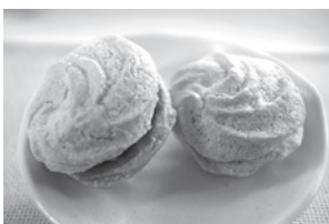
堺市長賞 ダックワーズ(愛和ハウス)

審査委員の皆様からは、「年々製品の質が上がっており、毎年楽しみにしている。」との評価もいただいております。なお本コンクールは、平成27年度も実施する予定です。多くの事業所の皆さんが意欲をもって参加してもらえるように見直しと工夫をしながら、引き続きコンクールの運営に取り組んでいきます。